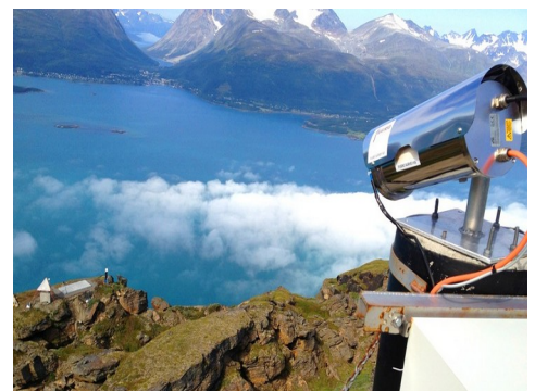
Abb 2: Gesteinsüberwachung mit Dimetix Laser Sensor