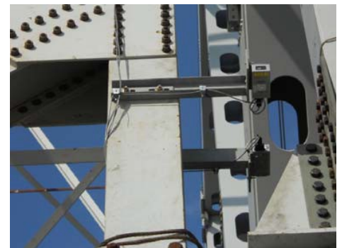
图 2: 安装好的传感器

基于激光的监测系统对升降机的操作至关重要。项目工程师能够实时使用它，以确切地了解升降机发生了什么，从而能够在不放慢操作速度的情况下“动态”调整桁架的姿态。据 HNTB 的副总裁兼桥梁集团总监约翰·布雷斯汀介绍，该系统还能够在桁架侧向滑入轴承上方位置的时监测桁架。而监测桁架的重要性相比于抬升桁架，可以说是有过之而无不及。