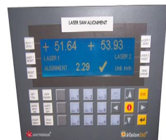
图 2: 控制器单元