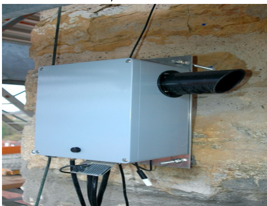
Abb 1: Dimetix Sensor installiert am Blauen Turm, Bad Wimpfen, Deutschland

Historische Bauten, darunter auch Kirchenbauten, sind Teil des kulturellen, religiösen und gesellschaftlichen Allgemeinguts, deren Erhaltung nicht nur im Interesse des Eigentümers, sondern über die Denkmalschutzverordnungen auch im öffentlichen Interesse liegt. Insbesondere beim Auftreten von Bausubstanzschäden, die eine statische Konsolidierung notwendig machen, sind die potenziellen Schäden durch die häufig vorhandenen Kunstwerke wie Fresken, Deckenornamente, Malereien etc. beträchtlich und damit auch die zu ergreifenden Schutz- und Sicherungsmassnahmen meist kostspielig.